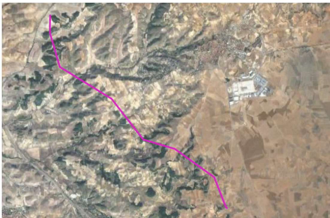
Figura 2. Localización del trazado de la línea eléctrica de evacuación sobre ortofoto.